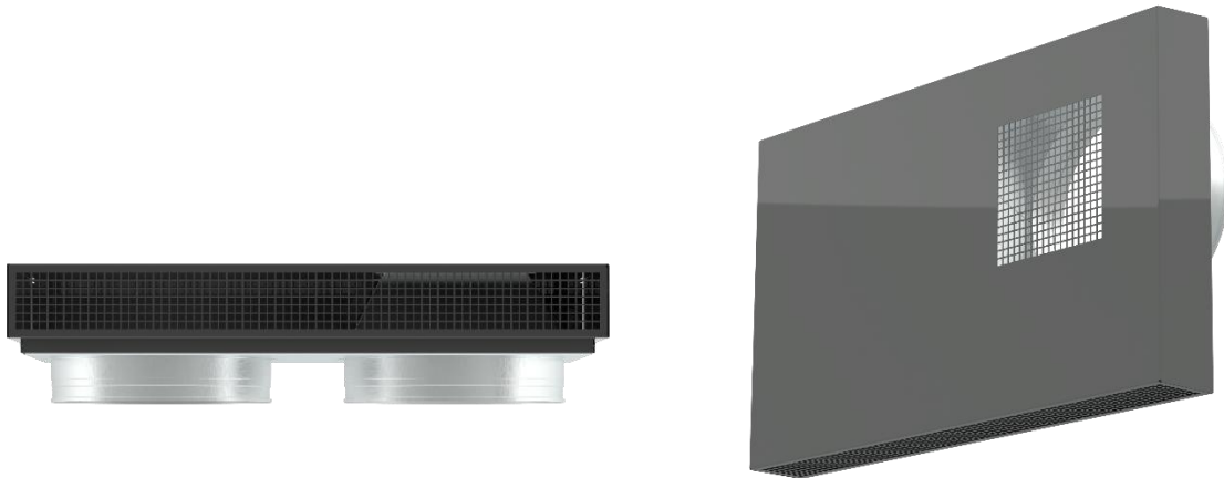
Afbeelding 1: Muurafdekking van onderen (links) en van voren (rechts)

De afdekking is ontworpen als een vast schild voor AM 900 als toevoer en afvoer zich dicht bij elkaar bevinden. De afdekking beschermt tegen externe kortsluitingen door de inlaat in de bodem van de afdekking en de uitlaat door het verticale rooster aan de voorkant te scheiden.